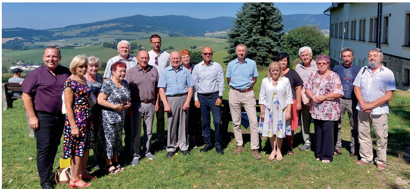
Setkání představenstev a předsedů kontrolních komisí KONZUMu Ústí nad Orlicí a Jednoty Zábřeh u příležitosti podpisu Memoranda o integraci dne 15. 8. 2023 v Králíkách.